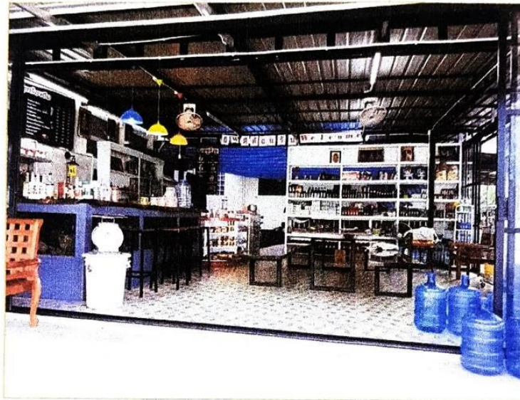
ภาพนักเรียน นักศึกษาที่ผ่านการบ่มเพาะและเป็นผู้ประกอบการในปัจจุบัน (เข้ารับการอบรมในปี 2559 สำเร็จการศึกษาปี 2560) นายกรณ์ศตร อุไร